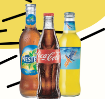
REFRESCOS PARA TODOS