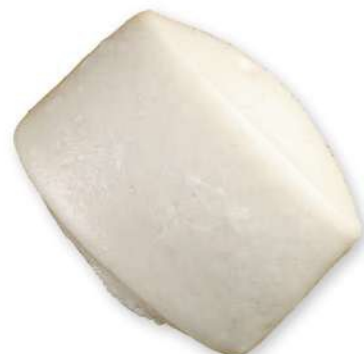
09 PAN GUABAO Panecillo suave cocido al vapor