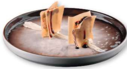
126 CRUNCHY SHAKE COCINADO Lámina crujiente, philadelphia, salmón cocido, salsa de trufa, salsa teriyaki € 3,00