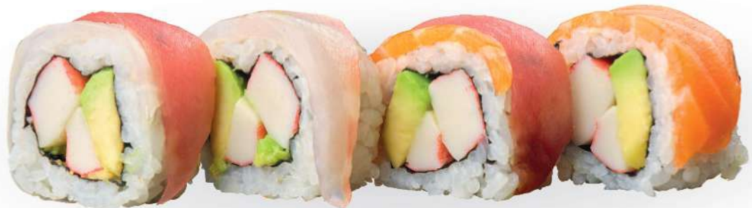
231 RAINBOW Surimi*, aguacate, pescado variado* crudo