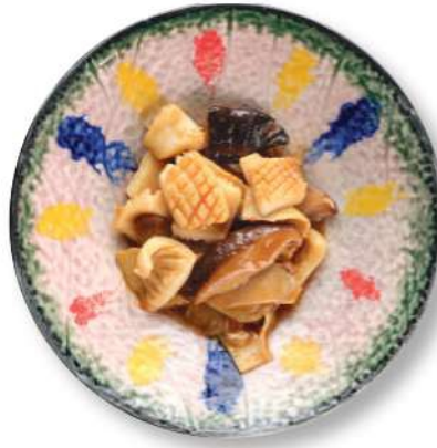
310 SEPIAS CON BAMBÚ Y HONGOS Sepias* con bambú y hongos