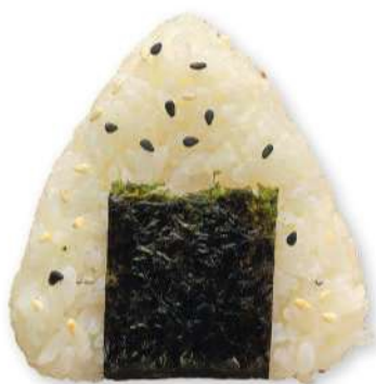
07 ONIGIRI Bolita de arroz rellena de salmón* y mayonesa, sésamo