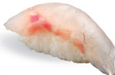
169 SUZUKI Branzino*