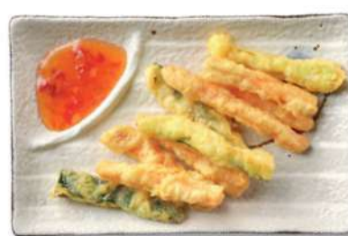
25 VERDURAS FRITAS Verduras mixtas fritas