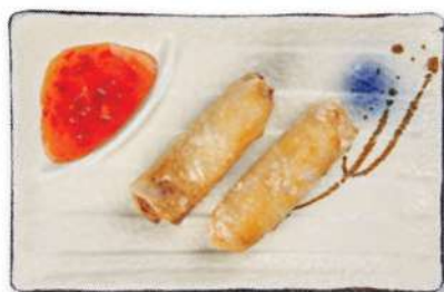
23 ROLLITOS VIETAMITOS Pollo, fideos, cebollas, zanahorias, salsa de pescado