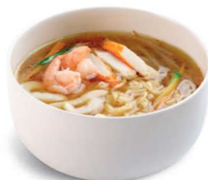
62 RAMEN CON PESCADO Fideos en caldo con mariscos mixtos* € 8,00