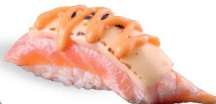
160 SHAKE CHEESE FIRE Salmón* sellado, queso, spicy maio