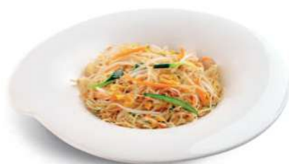
93 ESPAQUETIS DE ARROZ CON VERDURAS Spaguetti de arroz con verduras y huevos € 5,00