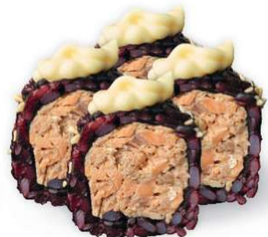
215 BLACK SAKE COCIDO Arroz negro, salmón* cocido, mayonesa, sésamo