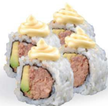
223 PHILLY TUNA Atún cocido, aguacate, mayonesa