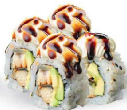
227 UNAGI URAMAKI Anguila*, aguacate, philadelphia, salsa teriyaki, sésamo