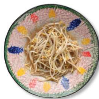
78 BROTOS DE SOJA SALTEADOS AL WOK Brotos de soja salteados al wok