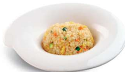
82 YASAI MESHU Arroz con huevos y verduras