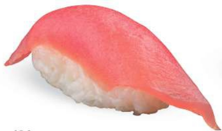
164 MAGURO Atún*