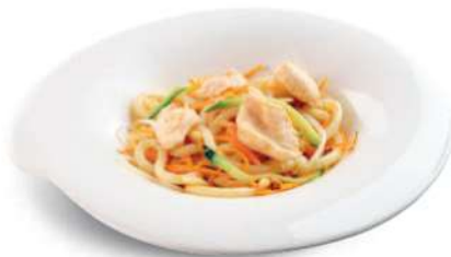
90 TORI UDON Fideos japoneses con pollo*, huevos y verduras