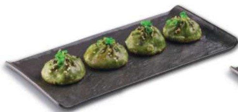
46 BAO VERDURA Te verde, col, zanahoria, cebolla, ajo, sesamo y cebollino