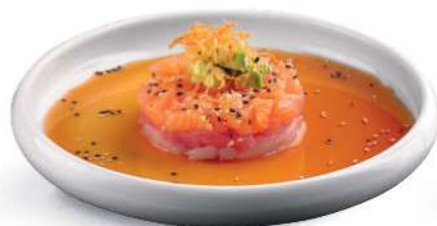
120 TARTARE MIXTA Tartare de lubina*, salmón*, atún*, aguacate, zanahoria frita, sésamo, salsa ponzu € 6,00