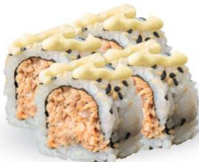
213 SAKE COCIDO Salmón* cocido, mayonesa, sésamo