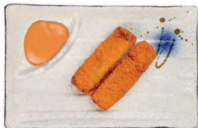
32 FILETE DE PESCADO Filete de pescado frito