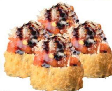
180 ESPECIAL URAMAKI FRITO (4pz) Surimi*, aguacate, salmón, tartar de salmón, salsa teriyaki, migas de tempura € 6,00