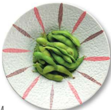
04 EDAMAME Vainas de soja