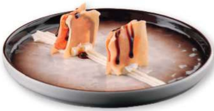
125 CRUNCHY SHAKE Lámina crujiente, philadelphia, tartar de salmón*, salsa teriyaki, huevas de pescado € 3,00