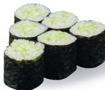
192 KAPPA MAKI Pepino