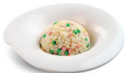
81 ARROZ 3 DELICIAS Arroz con huevos, guisantes* y jamón cocido