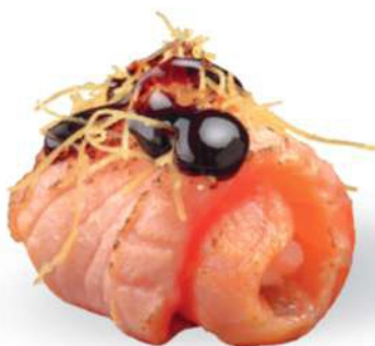
151 DUTOU SAKE Tempura de salmón*, philadelphia, salsa teriyaki, kataifi*, salmón* sellado