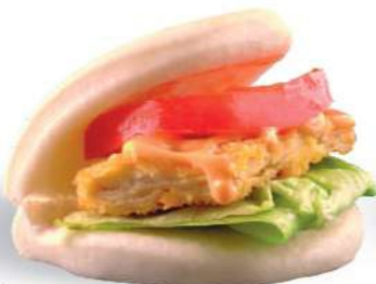
54 TORI GUABAO Pollo frito, ensalada, tomate, spicy mayonesa