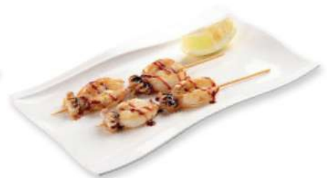
322 YAKI IKA Calamares a la parrilla con salsa teriyaki