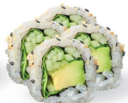
235 VEGGY MAKI Aguacate, ensalada