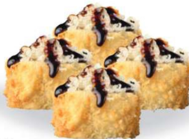
179 URAMAKI FRITO (4pz) Aguacate, surimi*, salmón*, salsa teriyaki, migajas de tempura € 5,00