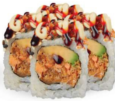
214 SAKE COCIDO PLUS Salmón* cocido, aguacate, mayonesa, salsa teriyaki, sésamo