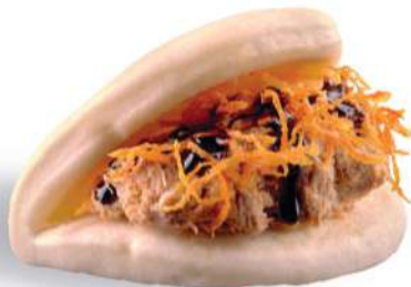
55 SHAKE GUABAO Salmón* cocido, zanahorias fritas, salsa teriyaki