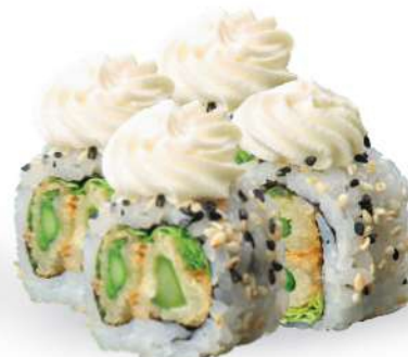
234 ASPARAGO MAKI Tempura de espárragos*, philadelphia, ensalada y sésamo