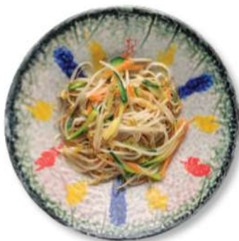
76 BROTOS DE SOJA Y VERDURAS Brotos de soja y verduras de temporada saltados al wok