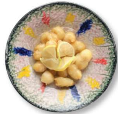
285 POLLO CON LIMÓN Pollo* rebozado con salsa de limon