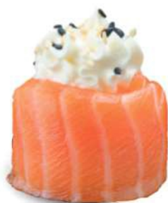
143 PHILADELPHIA Salmón*, arroz, philadelphia, sésamo