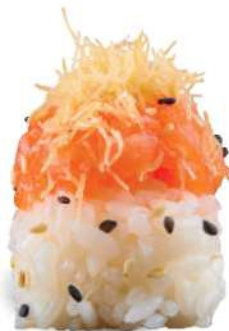
136 SAKE Salmón*, arroz, kataifi*, sésamo, mayonesa