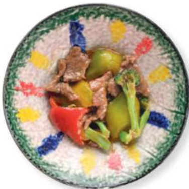
283 CARNE DE RES CON VERDURAS Carne de res con verduras de temporada