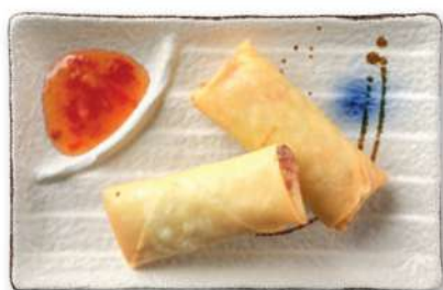
20 ROLLITOS DE VERDURAS Rollitos rellenos de verduras