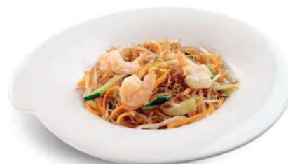
94 ESPAQUETIS DE SOJA CON CAMARONES Spaguetti de soja con camarones* y verduras € 6,00