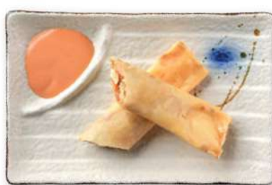
21 ROLLITOS DE SALMÓN Rollitos de salmón* fritos