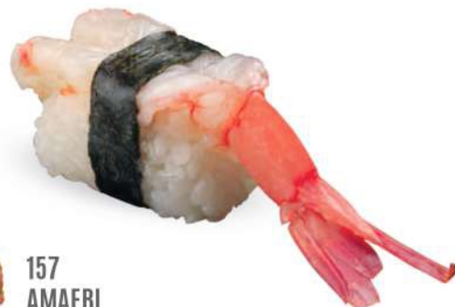
157 AMAEBI Camarón crudo*