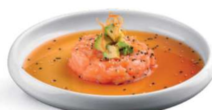
122 TARTARE SHAKE Tartare de salmón*, salsa ponzu, aguacate, zanahoria frita, sésamo € 6,00