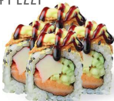
219 CALIFORNIA PLUS Surimi*, pepino, salmón*, sésamo, cebolla frita, mayonesa, salsa teriyaki