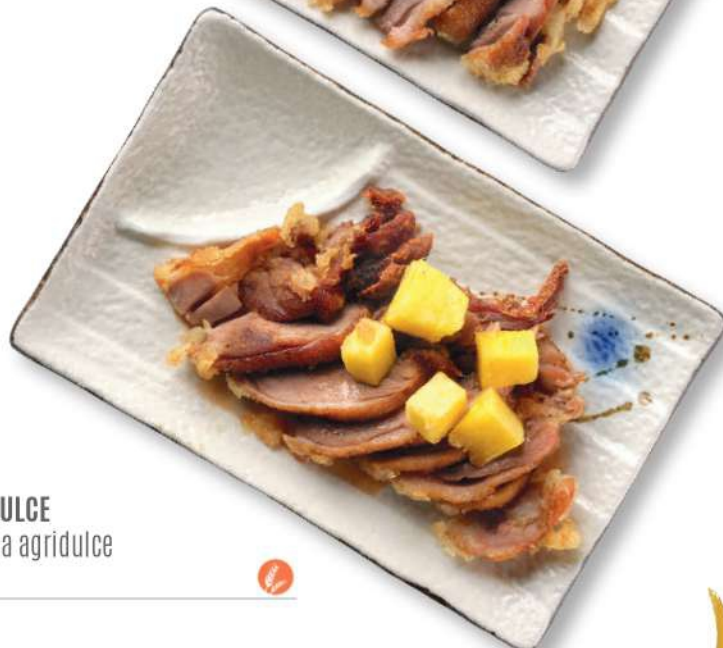
297 PATO AGRIDULCE Pato en salsa agridulce € 8,00