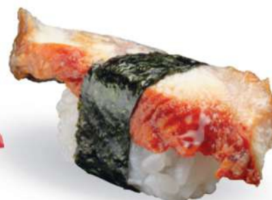
163 UNAGI Anguila* a la parrilla con salsa teriyaki