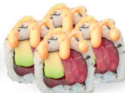
224 SPICY TUNA Atún*, aguacate, salsa picante