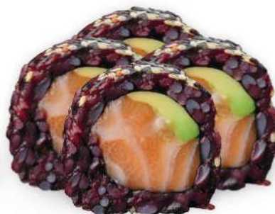
217 BLACK SALMON Arroz negro, salmón*, aguacate