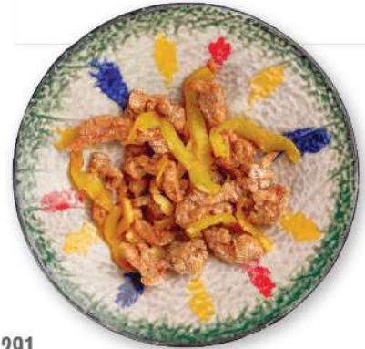
291 CERDO CON SAL Y PIMIENTA Cerdo salteado con sal y pimienta