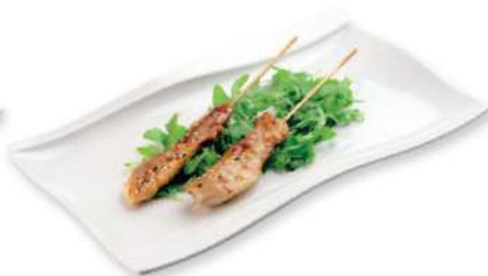
321 TORI TERIYAKI Pollo a la parrilla con salsa yakiniku y sésamo