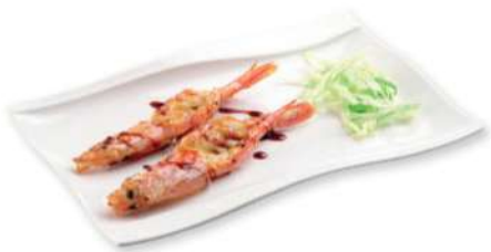
323 EBI SHIO YAKI Gambas* a la parrilla con salsa teriyaki