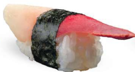
168 HOTATEGAI Vieira*