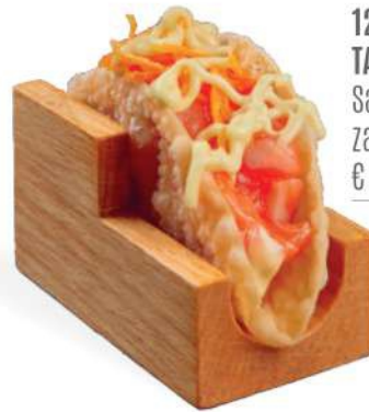
129 TACOS SHAKE Salmón, salsa avolime, zanahorias fritas € 6,00