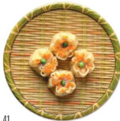
41 SHAO MAI Dumplings rellenos de carne y camarones*