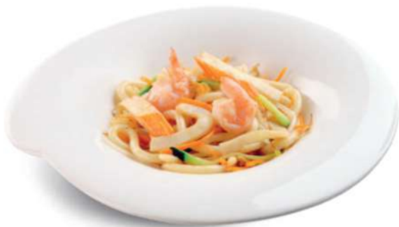
88 YAKI UDON Fideos japoneses con mariscos mixtos*, huevos y verduras