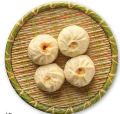
42 XIAO LONG BAO Dumplings rellenos de carne y hongos shiitake