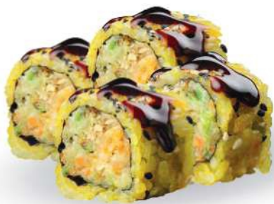
232 SPECIAL MAKI Arroz con azafrán con tempura de verduras, sésamo