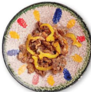
284 CARNE DE RES SAL Y PIMIENTA Carne de res sal y pimienta