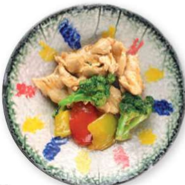
286 POLLO CON VERDURAS Pollo con verduras de temporada