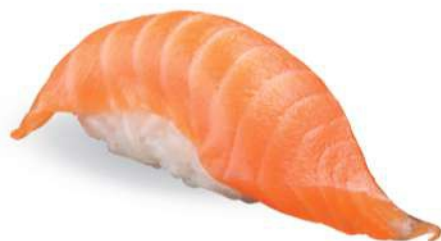
161 SAKE Salmón*