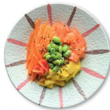
115 SAKE POKE Salmón*, mango, frijoles, zanahorias, sésamo, arroz € 10,00