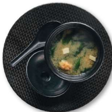
71 SOPA DE MISO CON WENDUM Miso, wendum