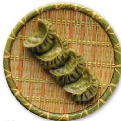
44 RAVIOLI DE VERDURAS Raviolis rellenos de verduras