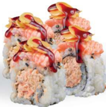
211 SALMON MANDORLA Salmón* cocido, salmón* a la parrilla, almendras, salsa teriyaki, philadelphia