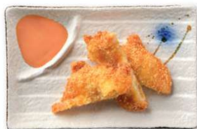
35 PESCADO FRITO Pescado frito*