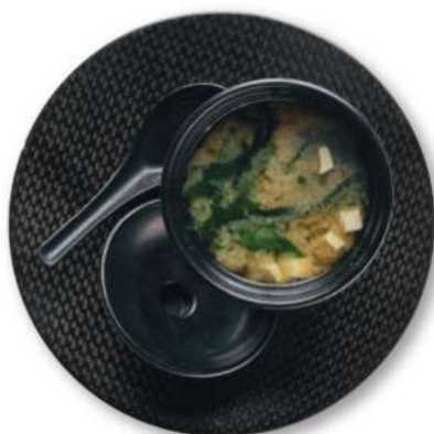
73 SOPA DE MISO Miso, algas, tofu