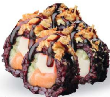
216 BLACK CALIFORNIA PLUS Arroz negro, surimi*, pepino, salmón*, sésamo, cebolla frita, mayonesa, salsa teriyaki