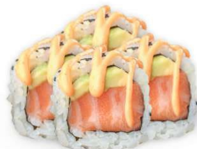
221 SPICY SALMON Salmón*, aguacate, salsa picante