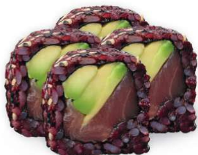
225 BLACK TUNA Arroz negro, Atún*, aguacate