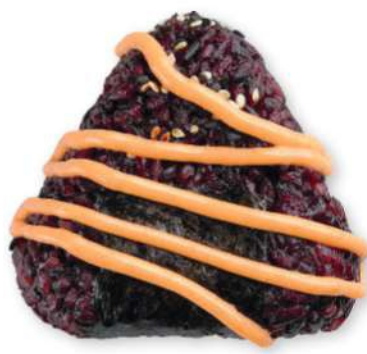
08 ONIGIRI BLACK Bolita de arroz negro rellena de salmón* cocido, mayonesa picante, sésamo