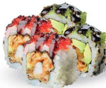
226 SOFTSHELL MAKI Tempura de cangrejo*, tobikko*, sésamo