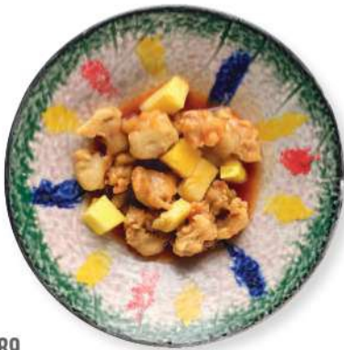
289 CERDO AGRIDULCE Cerdo en tempura frito, salsa agridulce