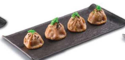
47 BAO DE GAMBAS Gambones, col, cebolla, cebollin, ajo, sésamo