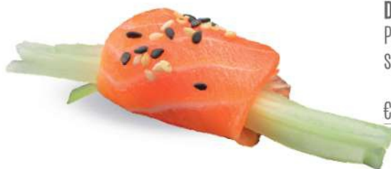
150 DUTOU SAKE Y VERDURAS Pepinos, philadelphia, salmón* y sésamo