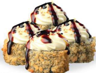
178 FUTOMAKI FRITO (4pz) Salmón*, aguacate, surimi*, philadelphia, salsa teriyaki, sésamo € 5,00