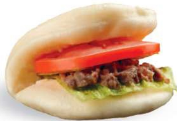
52 GUABAO CON TERNERA Carne de res, tomate, ensalada