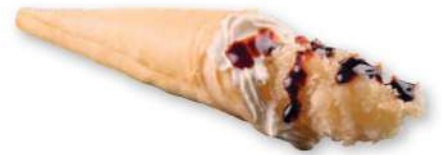
127 CONO EBITEN Lámina crujiente, camarones* en tempura, salsa teriyaki, cebollino, philadelphia € 3,00