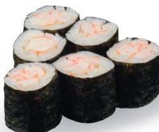
197 EBI MAKI Camarones*