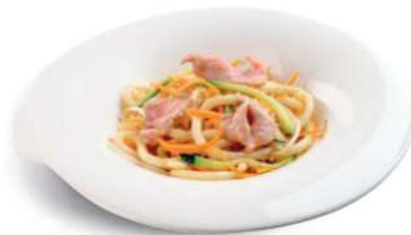
91 GYUUNIKU UDON Fideos japoneses con carne de res, huevos y verduras