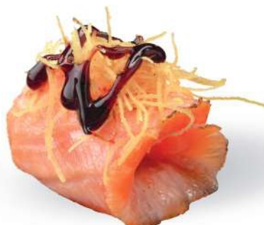
152 DUTOU EBI Tempura de camarones*, philadelphia, salsa teriyaki, kataifi*, salmón* sellado