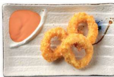
30 CALAMAR A LA ROMANA Anillas de calamar* fritas