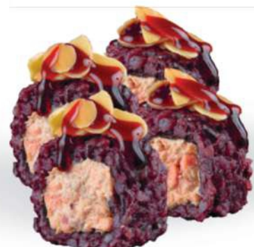
212 BLACK SALMON MANDORLA Salmón* cocido, arroz negro, almendras, salsa teriyaki, philadelphia