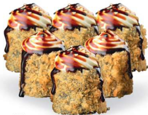
177 HOSO FRITTO (6pz) Salmón*, philadelphia, sésamo € 5,00