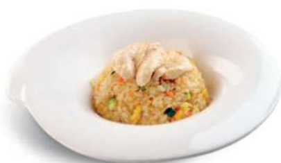
83 TORI MESHU Arroz con pollo*, huevos y verduras