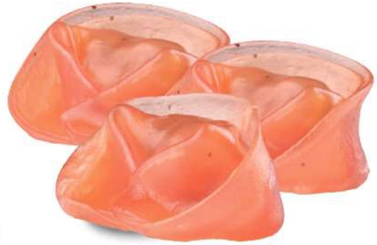
50 RAVIOLI DE TERNERA pastel de remolacha con ternera