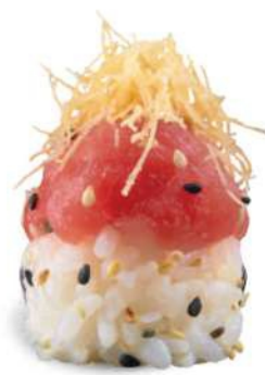
137 TUNA SPICY Atún*, arroz, sésamo, salsa picante, kataifi*, mayonesa