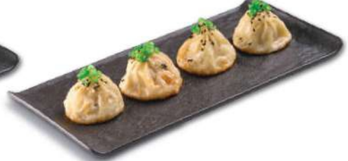
48 BAO DE CARNE Carne, col, cebolla, cebollin, ajo, sesamo