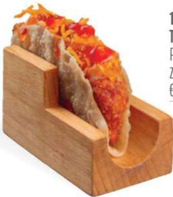
128 TACOS POLLO Pollo frito, salsa sweetchilly, zanahorias fritas € 4,00