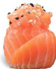
145 SAKE BIGNÈ Tartar de salmón*, mayonesa, arroz y tobikko*