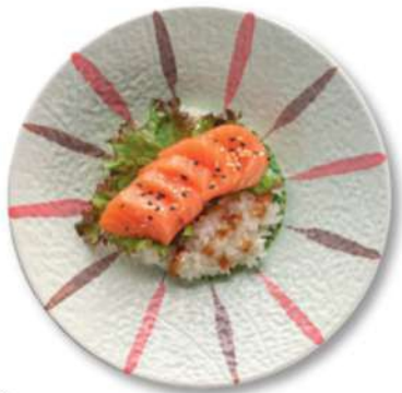
110 CHIRASHI SAKE DON Arroz cubierto de salmón*