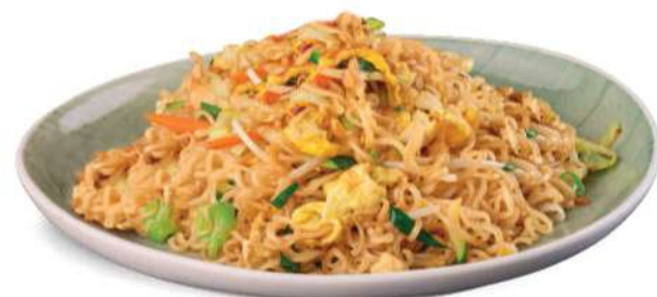
86 RAMEN YASAI Ramen salteado con zanahorias, calabacines, brotes de soja y huevos