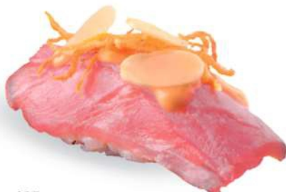
165 MAGURO FLAMBÈ SPICY Atún* sellado, salsa spicy maio, almendras crujientes, zanahorias, salsa teriyaki