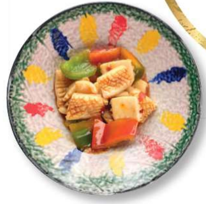
311 SEPIAS PICANTES Sepias* en tempura picante con pimientos