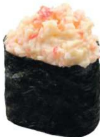
141 CALIFORNIA Cangrejo*, mayonesa, arroz