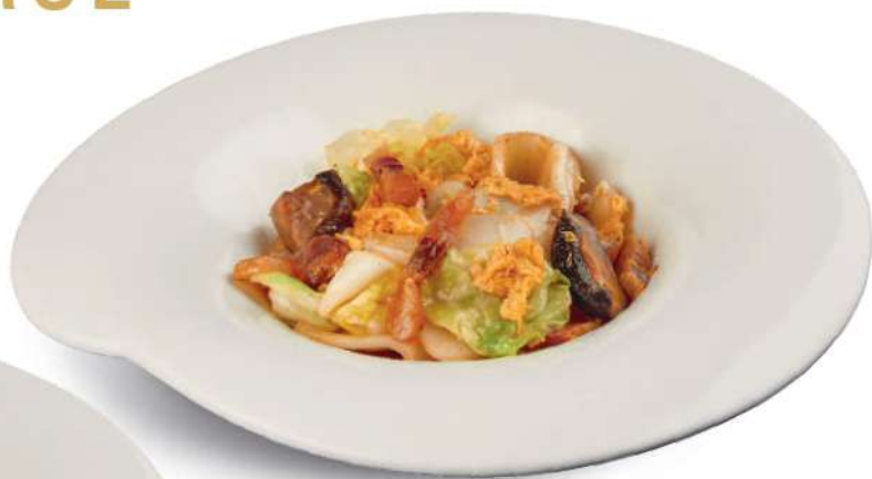
66 PASTEL DE ARROZ CON PANCETA Gnocchi de arroz con col rizada, panceta china, hongos shiitake, huevos € 5,00