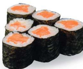
194 SAKE MAKI Salmón*