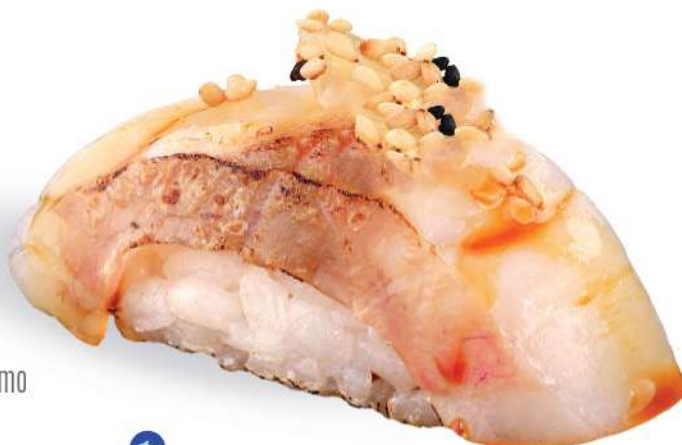
170 SUZUKI FIRE Branzino* sellado con salsa teriyaki y sésamo

El plato se puede pedir 2 veces por cada comensal