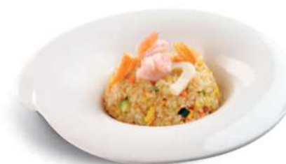
85 YAKI MESHU Arroz con camarones*, huevos y verduras