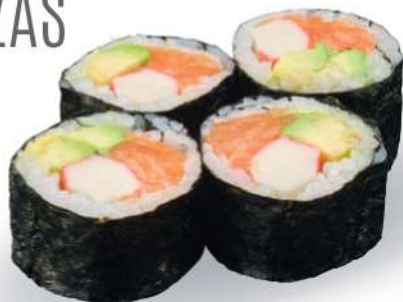
185 FUTOMAKI Salmón*, aguacate, surimi* € 6,00