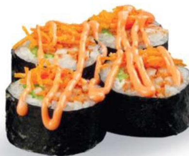
186 FUTOTORI Pollo*, ensalada, spicy mayo, zanahorias fritas € 6,00