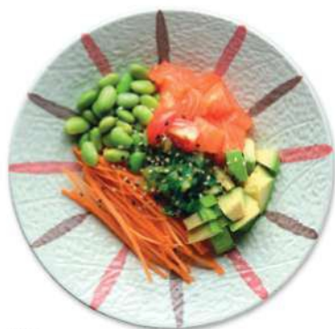
113 KAYI POKE Salmón*, algas, frijoles, aguacate, sésamo, arroz € 10,00