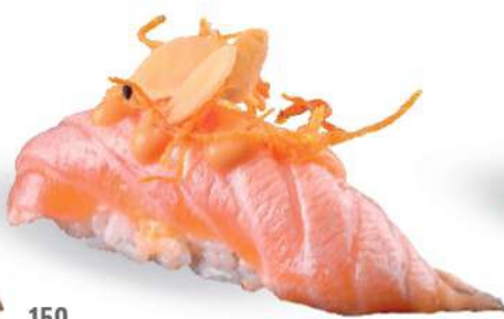
159 SHAKE FLAMBÈ SPICY Salmón* sellado, salsa spicy maio, almendras crujientes, zanahorias