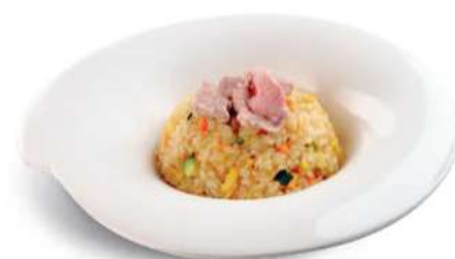
84 TENSHINHAN Arroz con carne de res, huevos y verduras