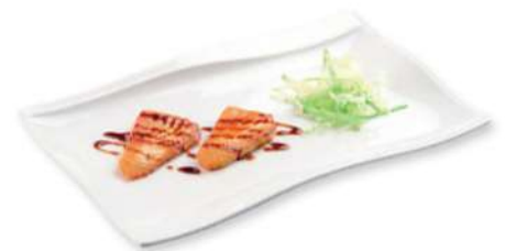
325 YAKI SAKE Ssalmón a la parrilla* con salsa teriyaki