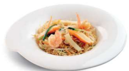
92 ESPAQUETIS DE ARROZ CON VERDURAS Spaguetti de arroz con verduras y huevos € 6,00