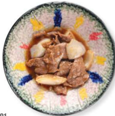
281 CARNE DE RES CON CEBOLLA Carne de res con cebolla