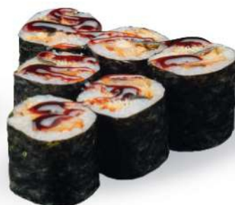
191 UNAGI MAKI Anguila*, sésamo y salsa teriyaki