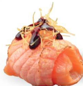
153 DUTOU ESPÁRRAGOS Tempura de espárragos, philadelphia, salsa teriyaki, kataifi*, salmón* sellado