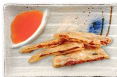
37 EMPANADA CHINA Rellena de salchicha y chucrut