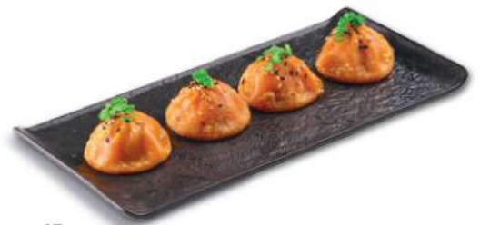
45 BAO POLLO Con tomate, pollo, col, cebolla, cebollino, ajo, sesamo y pimienta