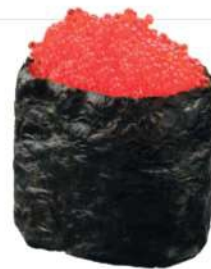
142 TOBIKKO Huevas de pez volador* y arroz