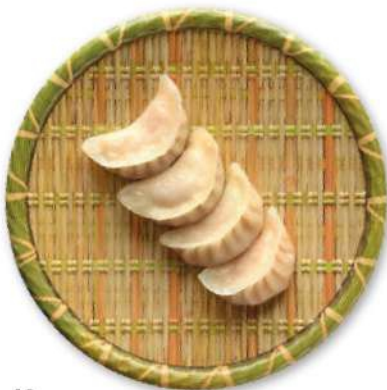
43 RAVIOLI TRANSPARENTES Raviolis rellenos de camarones*