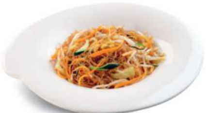
95 SPAGUETIS DE SOJA CON VERDURAS Spaguetti de soja con verduras mixtas € 5,00