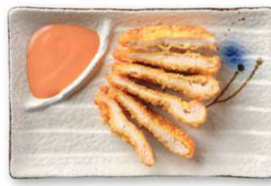
27 POLLO FRITO pollo* frito