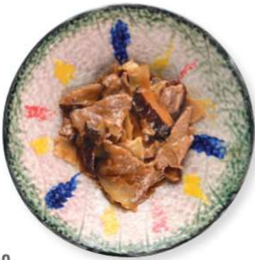
280 CARNE DE RES CON BAMBÚ Y HONGOS Carne de res con bambú y hongos

CARNE DE RES - POLLO CERDO - PATO - PESCADO