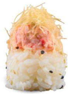
138 CALIFORNIA Cangrejo*, mayonesa, arroz, kataifi*, sésamo