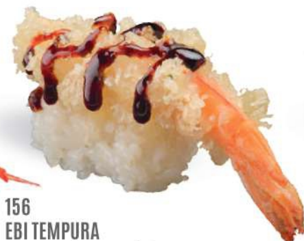
156 EBI TEMPURA Tempura de camarón*