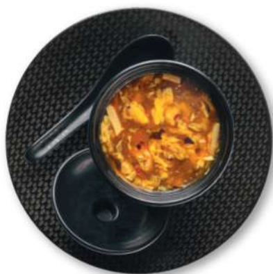
70 SOPA AGRIDULCE Tofu, bambú, pollo*, huevos, zanahorias, orejas de judas, almidón de patata