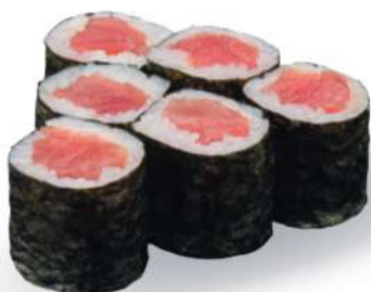
190 TEKKA MAKI Atún*