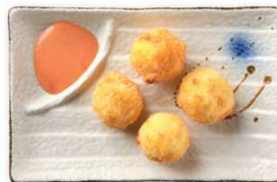
34 CROQUETAS DE CAMARÓN Croquetas de patata rellenas de camarones*