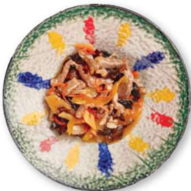
292 CERDO PICANTE Cerdo picante con pimientos