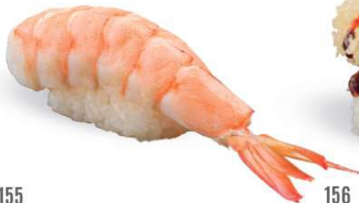
155 EBI Camarón* cocido