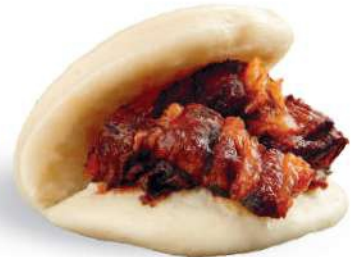
53 GUABAO CON PANCETA panceta, verduras secas chinas