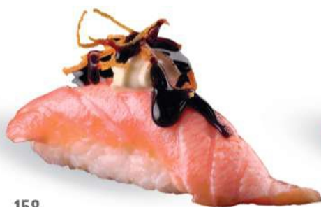
158 SHAKE FIRE Salmón* sellado, salsa teriyaki, philadelphia, zanahorias

El plato se puede pedir 2 veces por cada comensal