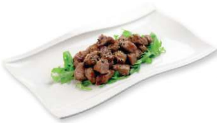
320 GYUNIKU TERIYAKI Roast beef a la parrilla con salsa yakiniku