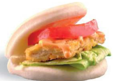
56 CRUNCHY FISH GUABAO Pescado frito, ensalada, tomate, spicy mayonesa