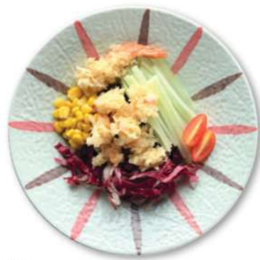
114 EBI POKE Camarones* en tempura, achicoria roja, pepinillos, maíz, salsa teriyaki, arroz € 10,00