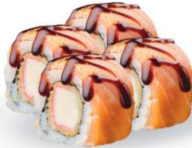
229 KAYI MAKI Tempura de surimi*, salmón* salteado