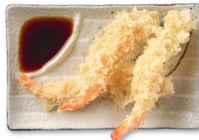
31 EBI TEMPURA Gambas fritas*