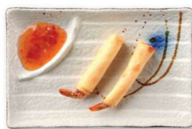
22 ROLLITOS DE CAMARONES Rollitos rellenos de camarones*