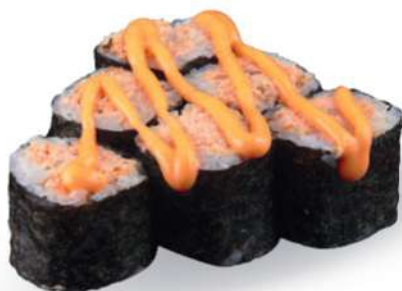
196 MIURA SPICY Salmón* a la plancha, salsa picante