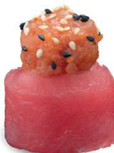
144 TUNA BIGNÈ Tartar de atún*, salsa picante y arroz