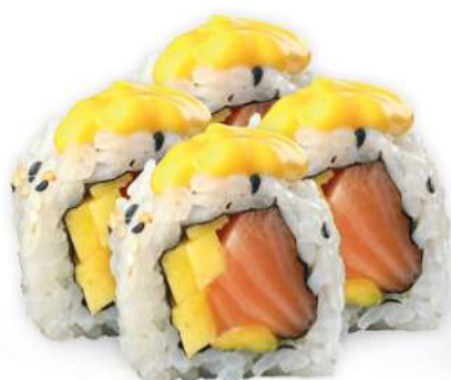
222 SALMON MANGO Salmón*, mango, salsa de mango y philadelphia