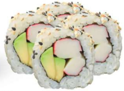
230 CALIFORNIA Surimi*, aguacate, sésamo