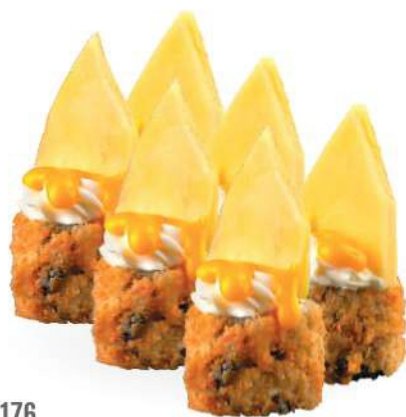
176 MANGOMAKI (6pz) Salmón*, philadelphia, mango y salsa de mango € 6,00