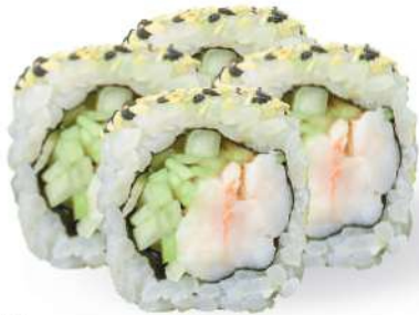
228 EBI URAMAKI Gambas cocidas*, pepino, sésamo