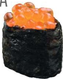
140 IKURA Huevas de salmón* y arroz