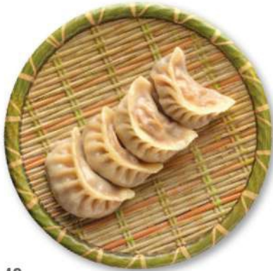
40 RAVIOLI DE CARNE Raviolis rellenos de carne y verduras