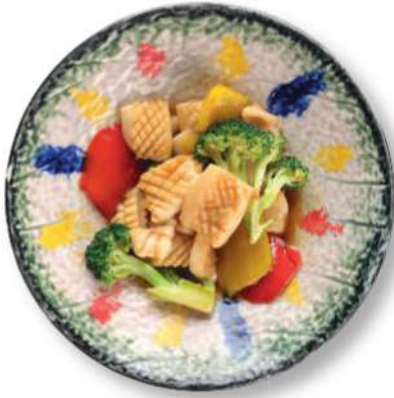
309 SEPIAS CON VERDURAS Sepias* con verduras