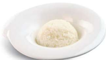
80 ARROZ BLANCO Arroz blanco