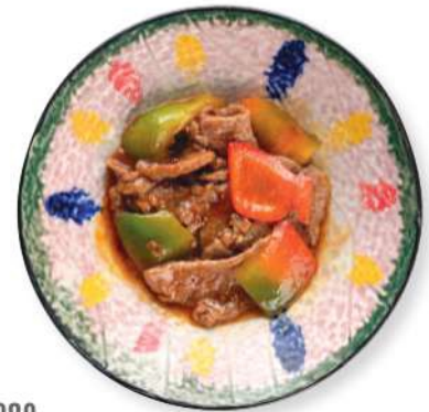
282 CARNE DE RES PICANTE Carne de res picante con pimientos