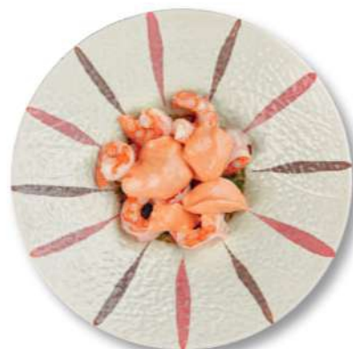
03 CÓCTEL DE CAMARONE Camarones* cocidos en salsa rosa