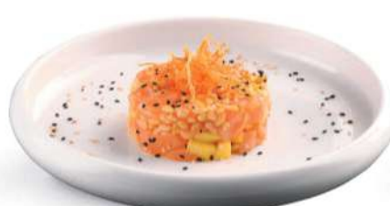
121 TARTARE SHAKE CRUNCH Tartare de salmón*, mango, arroz inflado, sésamo € 6,00