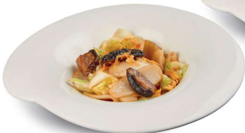
65 PASTEL DE ARROZ CON VERDURAS Gnocchi de arroz con col rizada, hongos shiitake, huevos