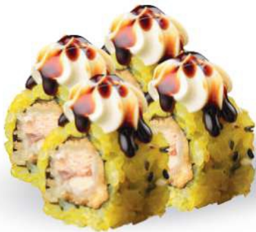
210 TANUKI MAKI Tempura de salmón*, philadelphia, sésamo