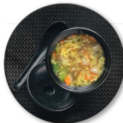
72 SOPA DE ESPÁRRAGOS Espárragos*, cangrejo*, huevo, almidón de patata