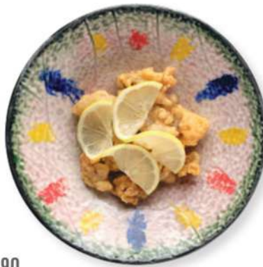
290 CERDO AL LIMÓN Cerdo en tempura frito con salsa de limón