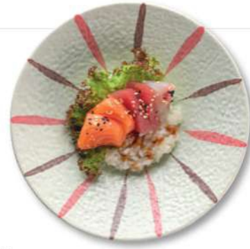
112 CHIRASHI MORIAWASE Arroz con salmón*, atún* y lubina*