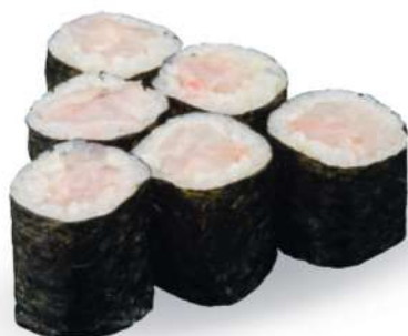
193 SUZUKI MAKI Branzino*