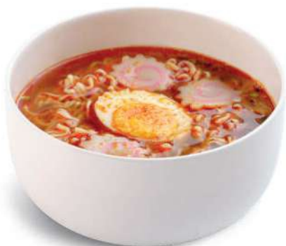
60 RAMEN PICANTE Fideos en caldo picante con naruto* y huevo duro € 7,00