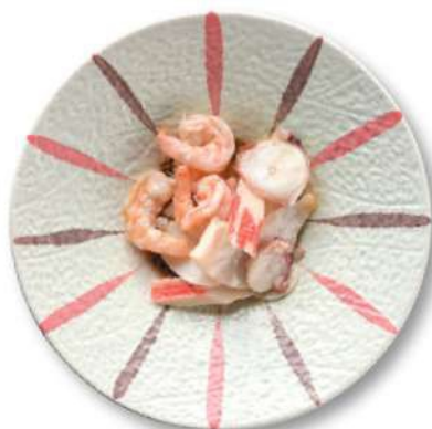
02 ENSALADA DE MARISCOS Mariscos mixtos* y verduras