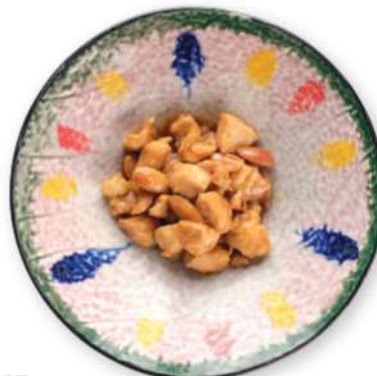
287 POLLO CON ALMENDRAS Pollo con almendras