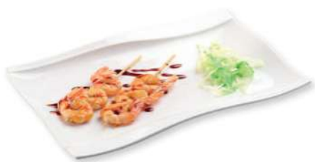
324 YAKI EBI Brochetas de gambas* a la parrilla con salsa teriyaki