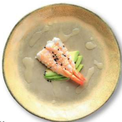
01 EBISU Camarones*, aguacate, vinagre de arroz