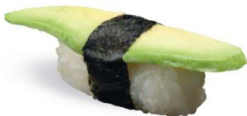
167 AVOCADO Aguacate