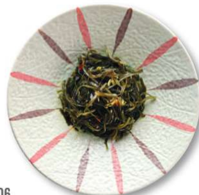
06 ALGA Alga*, salsa agri dulce picante, sésamo