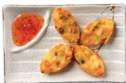
26 CROQUETAS DE VERDURAS Croquetas de patata con relleno de verduras