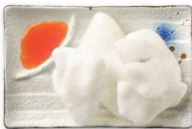
29 NUBES DE CAMARÓN