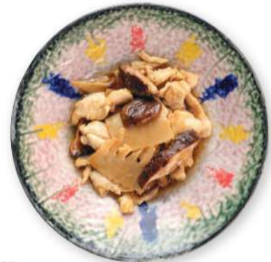
288 POLLO CON BAMBÚ Y HONGOS Pollo con bambú y hongos