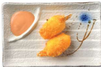
33 PINZAS DE CANGREJO Pinzas de cangrejo* fritas