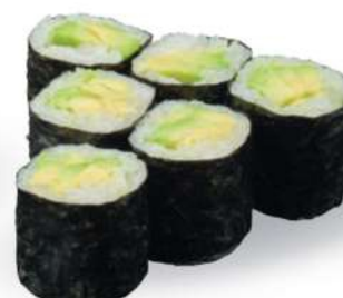
198 AVO MAKI Aguacate