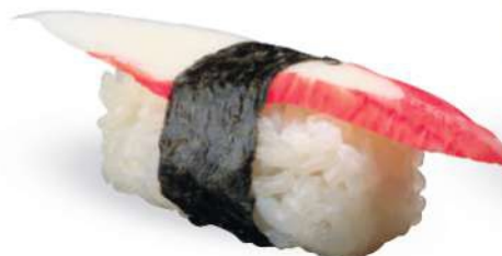
162 KANI Surimi*