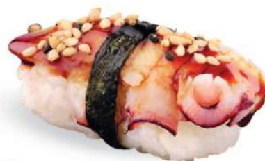
166 TAKO Pulpo* cocido con salsa teriyaki, sésamo tostado