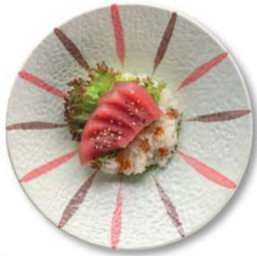
111 CHIRASHI TEKKA DON Arroz cubierto de atún*