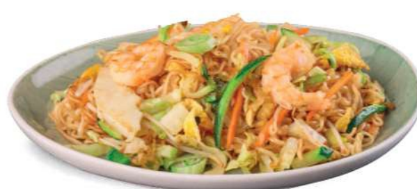
87 RAMEN KAISEN Ramen salteado con mariscos mixtos*, verduras y huevos