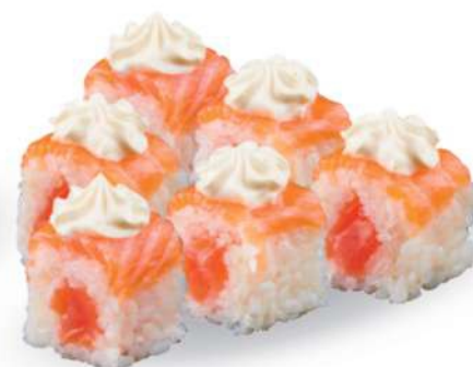
195 FRESHI SALMON Salmón*, philadelphia