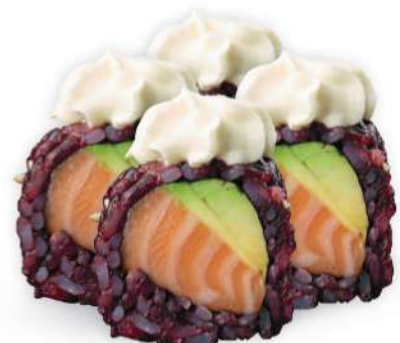
218 BLACK PHILADELPHIA Arroz negro, salmón*, philadelphia, aguacate