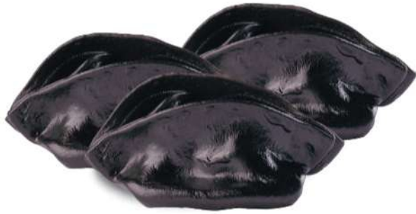
49 RAVIOLI DE CALAMAR Masa negra de sepia con calamar* (3 piezas)