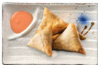
36 SAMOSA DE CAMARÓN Triángulos de croquetas de camarón* fritos