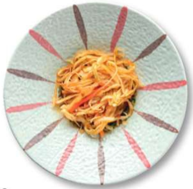
10 VERDURAS SPICY Verduras con salsa agridulce picante