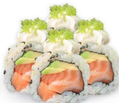
220 PHILADELPHIA Salmón*, aguacate, philadelphia, tobikko*