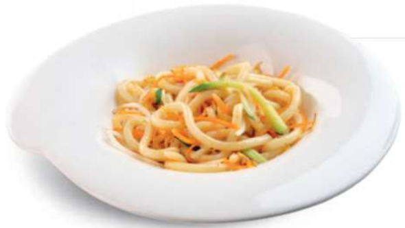
89 YASAI UDON Fideos japoneses con huevos y verduras