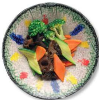
77 VERDURAS DE TEMPORADA SALTEADAS AL WOK Verduras mixtas de temporada salteadas al wok