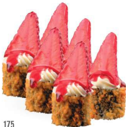
175 FRAGOLAMAKI (6pz) Salmón*, philadelphia, fresa y cobertura de fresa € 6,00