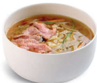
61 RAMEN CON CARNE DE RES Fideos en caldo con carne de res € 8,00